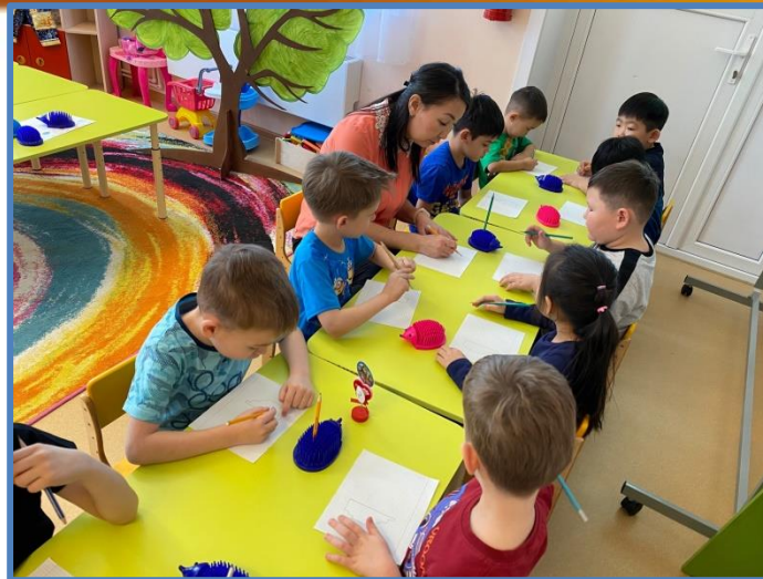
Задание от Добрыни Никитича