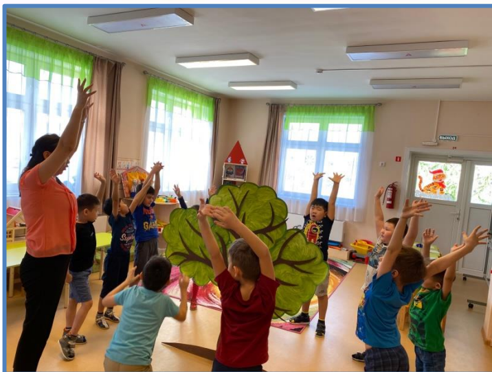
Физкультминутка «Обряд поклонение Дубу»